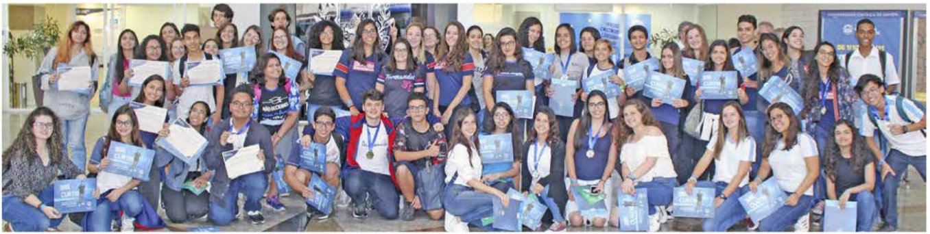
Na IX Jornada de Iniciação Científica para o Ensino Médio, 57 estudantes de 15 escolas conveniadas apresentaram os resultados das suas pesquisas e receberam certificados