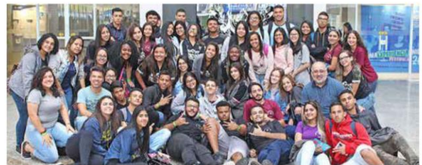
E. E. Ary de Oliveira Garcia, de Cubatão, participou com o maior número de estudantes