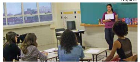
Programa de Orientação é desenvolvido por meio de atividades de autoconhecimento e dinâmicas

empresas que buscam colaboradores com um perfil diferenciado, o evento possibilitou que os estudantes entregassem o currículo, fizessem cadastro e trocassem informações com profissionais altamente qualificados.