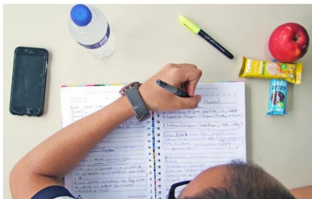
ALIMENTAÇÃO — Foto: Departamento de Imprensa/Unisantos

No dia da prova, segundo o nutricionista Cezar Azevedo, o ideal é levar um lanche rápido, como barra de cereal. Veja o rótulo e prefira aquelas com boa quantidade de componentes alimentares, como castanhas, uva passa, amêndoas ou aveia, frutas desidratadas (uva, banana, maçã ou lascas de coco), castanhas (pode ser um mix de caju, do brasil ou amêndoas) e até mesmo um chocolate”.