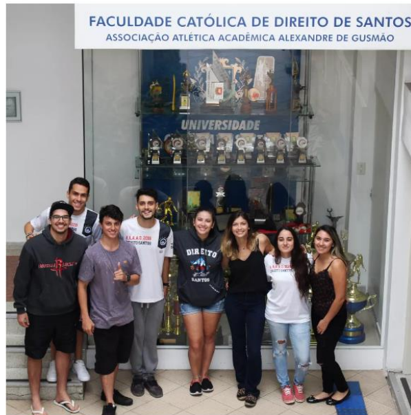
ATLÉTICA - DIREITO INTERNA — Foto: Departamento de Imprensa/UniSantos

As atléticas contam com salas próprias para desenvolver o trabalho, realizar reuniões e manter a guarda de documentos e objetos.