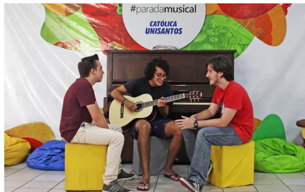
PROJETO CULTURAL - PARADA MUSICAL

PREMIADO – Formado por estudantes de diferentes cursos da universidade, o Grupo Experimental de Teatro UNISANTOS (Gextus) é reconhecido pela história de sucesso e suas muitas premiações. Nos dois últimos anos, ele foi o grande vencedor, na categoria adulto, do Festival de Cenas Teatrais - Fescete, conquistando o 1º lugar pelo voto dos jurados e voto popular, e ainda prêmio como Melhor Texto original, Melhor Figurino, Melhor Iluminação e Menção Honrosa.