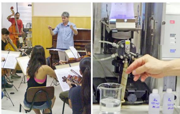
Departamento de Imprensa/Unisantos — Foto: Unisantos - Laboratórios

O prazo para inscrição do Vestibular é o dia 16 de outubro, pelo www.unisantos.br/vestibular , ou até 19 de outubro, de segunda a sexta-feira, de forma presencial, das 11 às 20h30, e aos sábados, das 9h30 às 14 horas, no Campus Dom Idílio José Soares (Avenida Conselheiro Nébias, 300). A taxa de inscrição é de R$40,00. No dia 21 de outubro, das 8h30 às 12 horas, será realizada a prova, composta de Redação e 40 questões objetivas sobre Língua Portuguesa, Literatura Brasileira e Língua Estrangeira, História Geral e do Brasil, Geografia Geral e do Brasil, Matemática, Física, Química e Biologia.