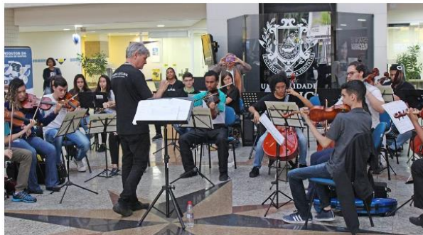
PROJETO CULTURAL - WORKSHOP ORQUESTRAL-1

PARADA MUSICAL – Com o objetivo de promover intervenções musicais espontâneas e revelar os talentos entre os estudantes, a UNISANTOS oferece o espaço #paradamusical, nos campi Dom Idílio José Soares e Boqueirão. Próximo ao hall de entrada, eles contam com piano e violão à disposição. O incentivo tem proporcionado encontros musicais e formação de grupos com alunos de cursos de diferentes áreas do conhecimento. Próximo aos locais, também ocorrem apresentações de bandas musicais independentes, que contam com toda infraestrutura para as apresentações.